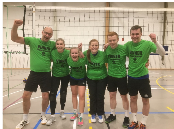
Mix 2: Sand & Stein