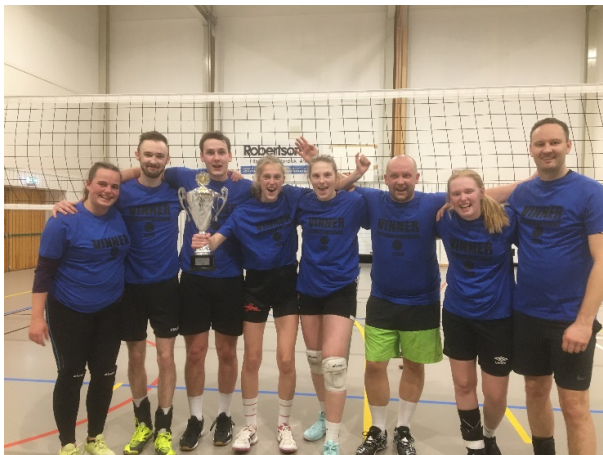
Vinnere 2020: Mix 1: «Rett fra sofaen»

Grendaturneringa er et årlig og vellykket arrangement som betyr mye for økonomien i volleyballavdelinga. I 2019 deltok 16 lag i turneringa og den 24-25 januar i 2020 deltok 17 lag.